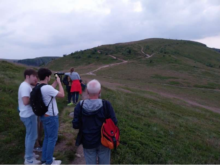
Sortie Chamois juin 2023