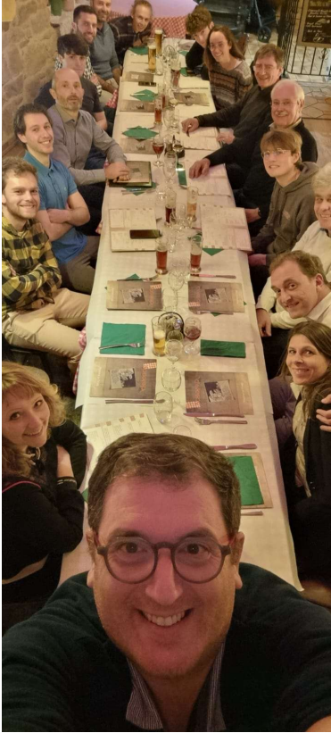
Accueil Elèves 2/11/2023