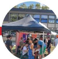
Le Forum des Associations