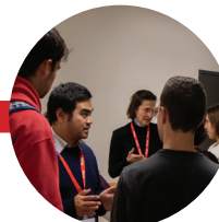
La soirée de rencontre parrains/filleuls : Connexions