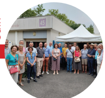
La journée des Bénévoles