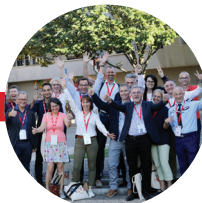
Le week-end Générations INSA