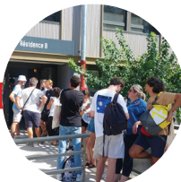
La chaîne de rentrée