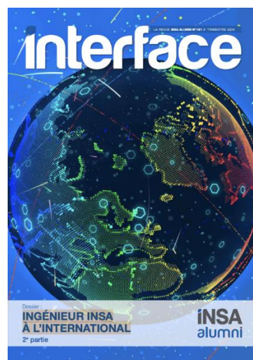
n° 161 3 ème trimestre 2024