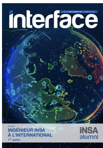
n° 150 2 ème trimestre 2022