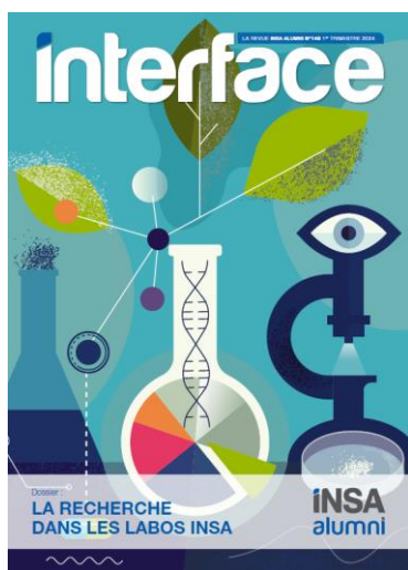
n° 149 1 er trimestre 2024